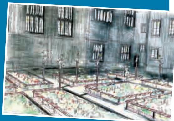
Boceto de artista del proyecto de Jardín de Chapel Court.

En el diseño se incluirán algunas características distintivas de los jardines de la corte Tudor: macizos de flores, herbarios, topiaria y barandas decoradas. También hemos encargado ocho "bestias reales", talladas en madera y recubiertas de una capa dorada: un toro, un dragón, un halcón, un leopardo, un galgo, un león, una cierva blanca y un yale.